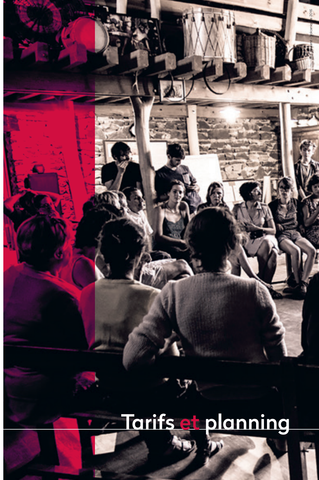
© F. Esnard - Volcanique 2016